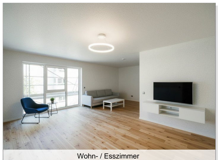
Wohn- / Esszimmer