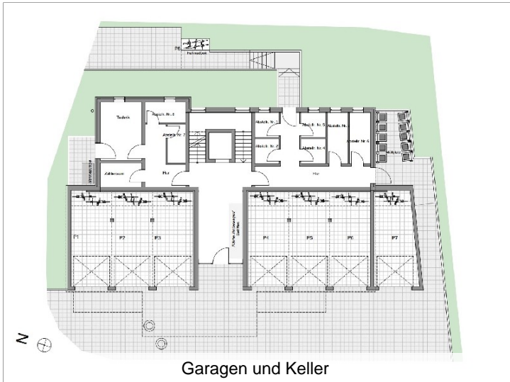
Garagen und Keller