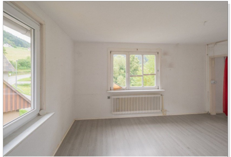
Esszimmer / Wohnzimmer