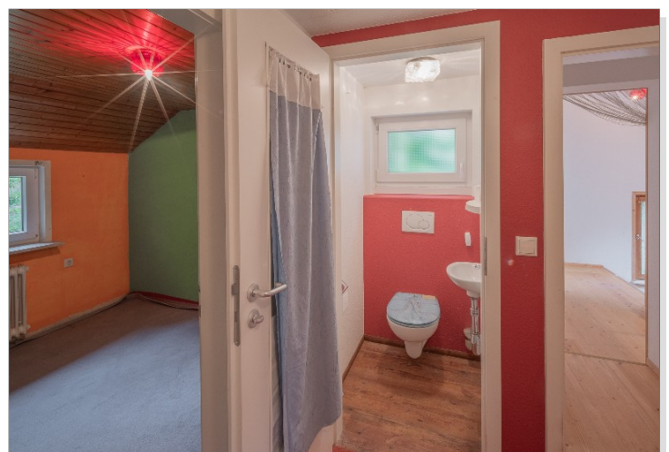
Kinderzimmer / WC / Flur