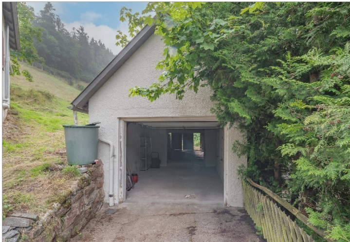
Garage mit Schuppen