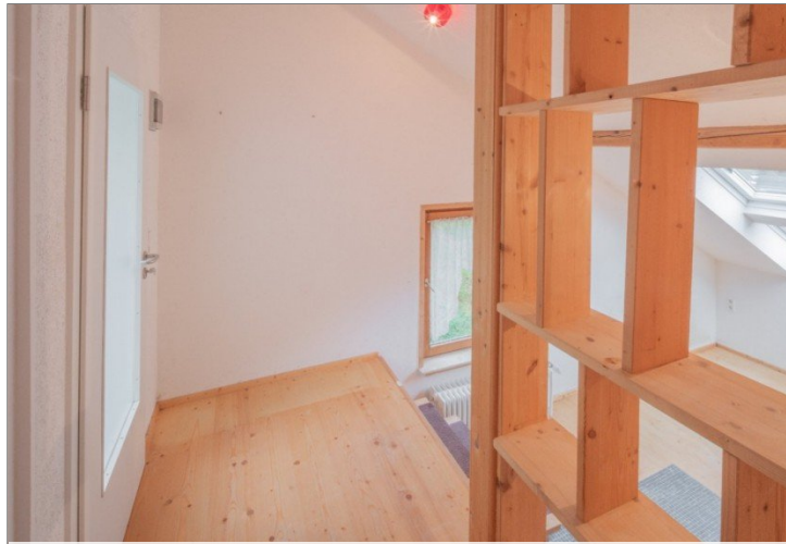
Zugang extra Küche