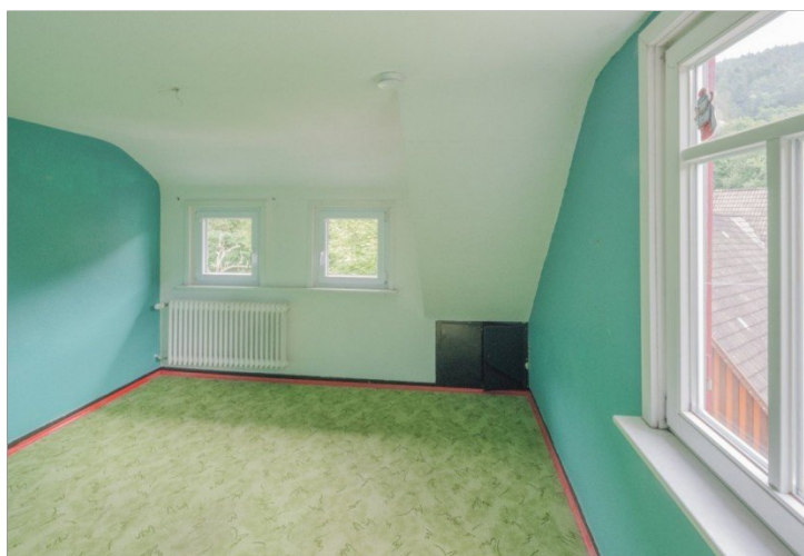
Elternschlafzimmer mit Umkleide