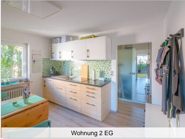
Wohnung 2 EG