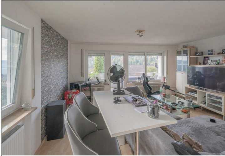
Wohnung 1 EG