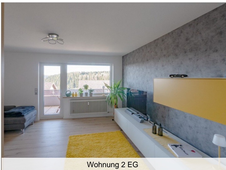
Wohnung 2 EG