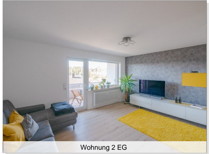
Wohnung 2 EG