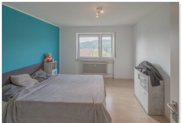
Wohnung 1 EG