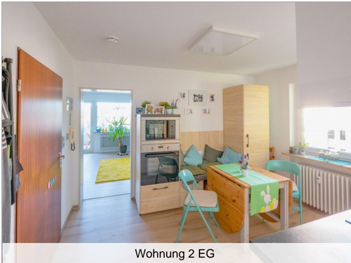
Wohnung 2 EG