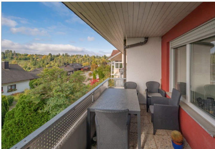
Balkon Wohnung 1 EG