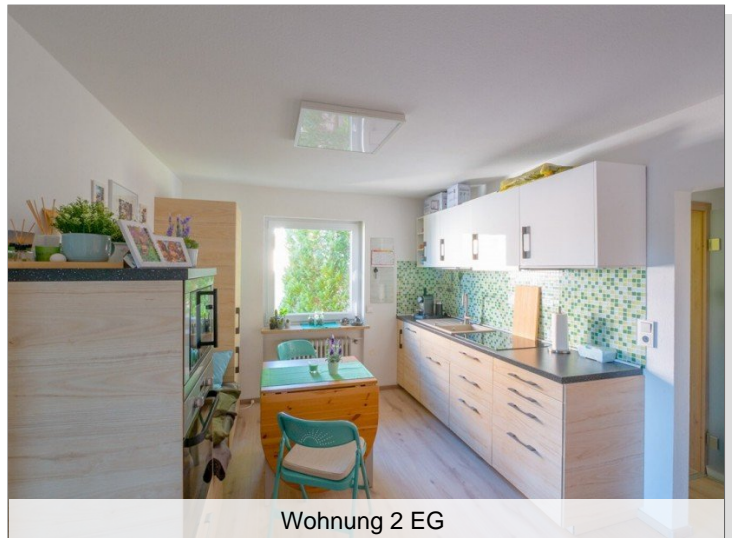
Wohnung 2 EG