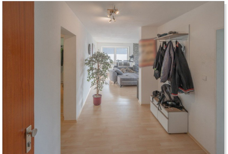
Wohnung 1 EG