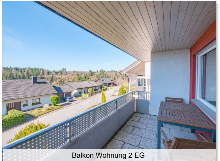
Balkon Wohnung 2 EG