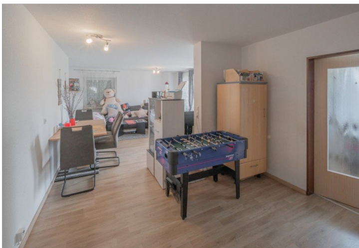
Wohnung 1 EG