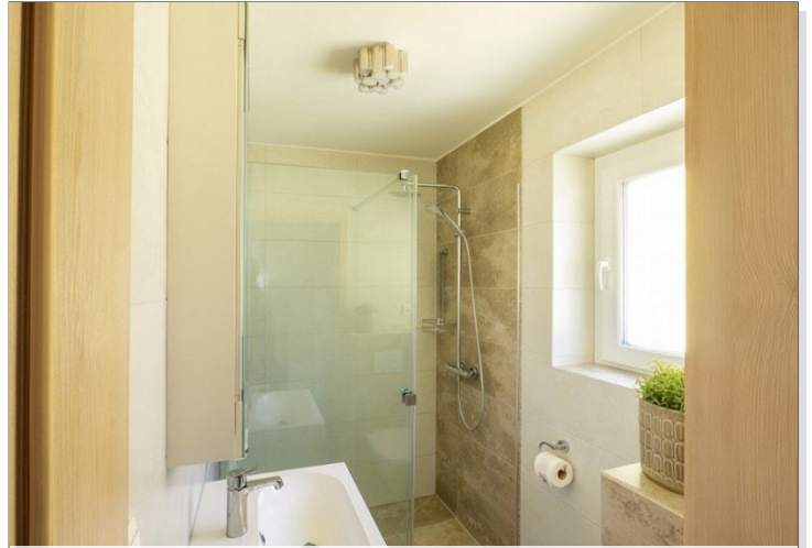
Wohnung 2 EG