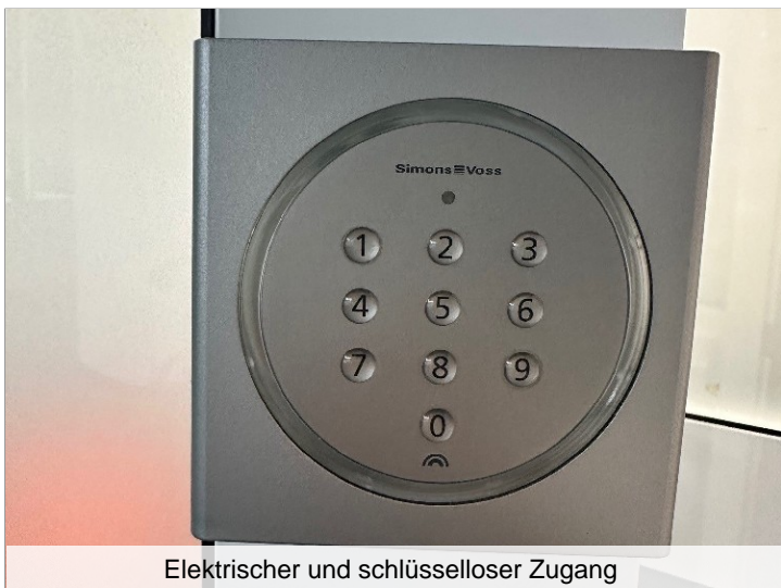
Elektrischer und schlüsselloser Zugang