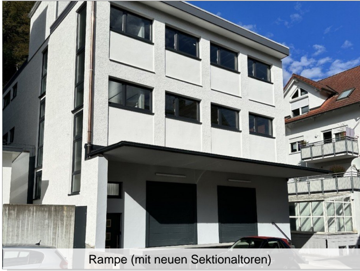
Rampe (mit neuen Sektionaltoren)