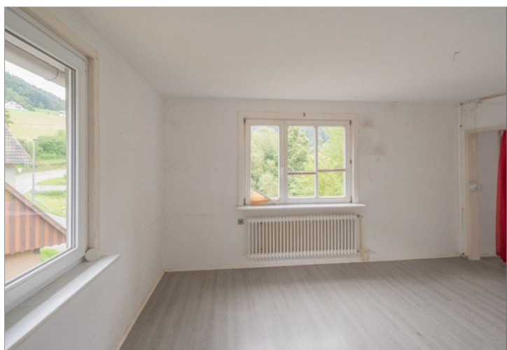
Esszimmer / Wohnzimmer