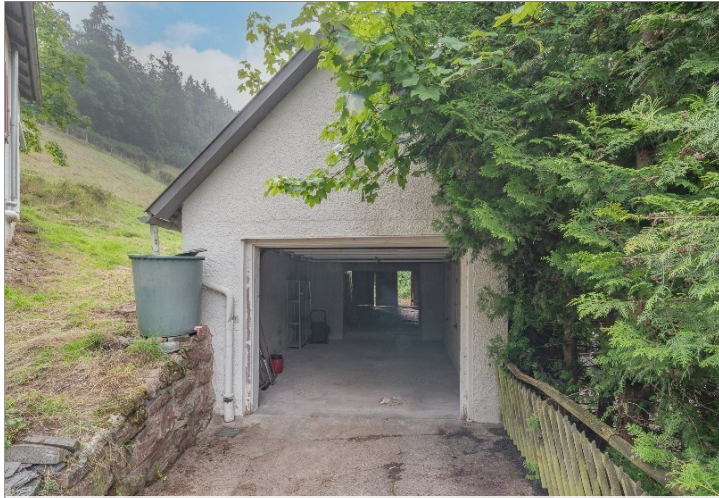
Garage mit Schuppen