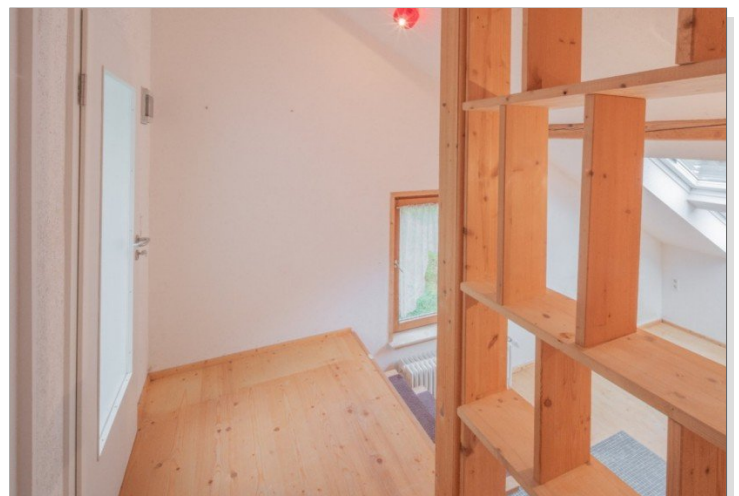
Zugang extra Küche